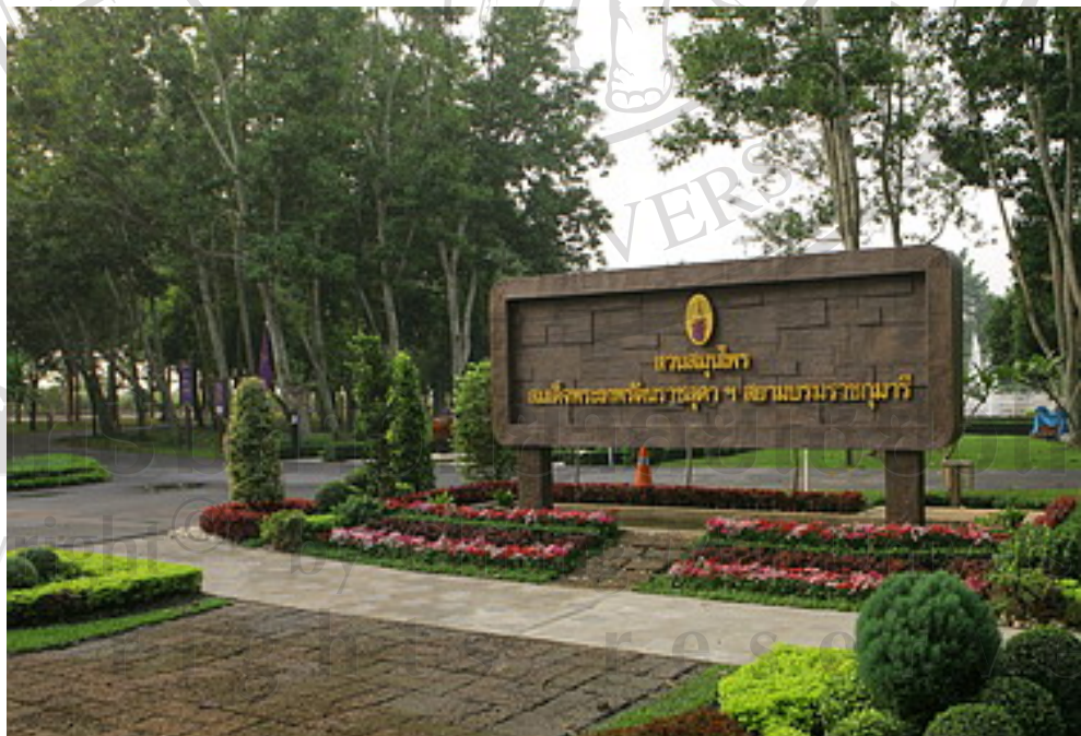
ภาพ 4 ภาพแสดงป้ายสวนสมุนไพรมหาสมุทร บริเวณหน้าทางเข้าสวนสมุนไพรมหาสมุทร