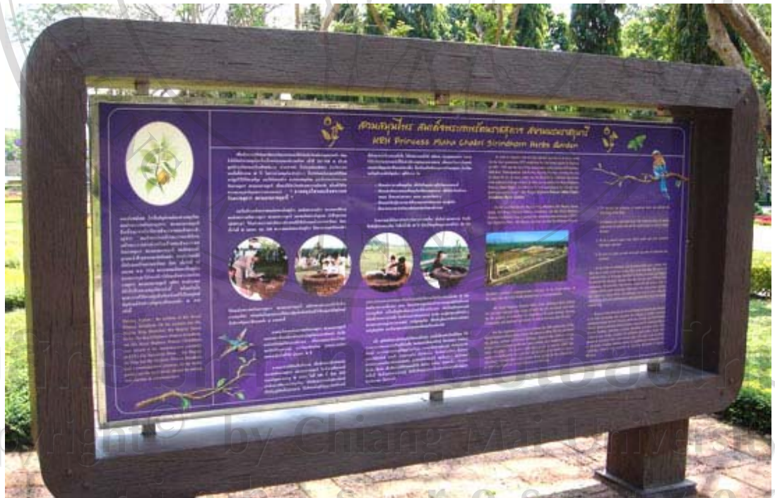
ภาพ 7 ภาพแสดงป้ายแสดงประวัติความเป็นมาของสวนสมุนไพรมุข