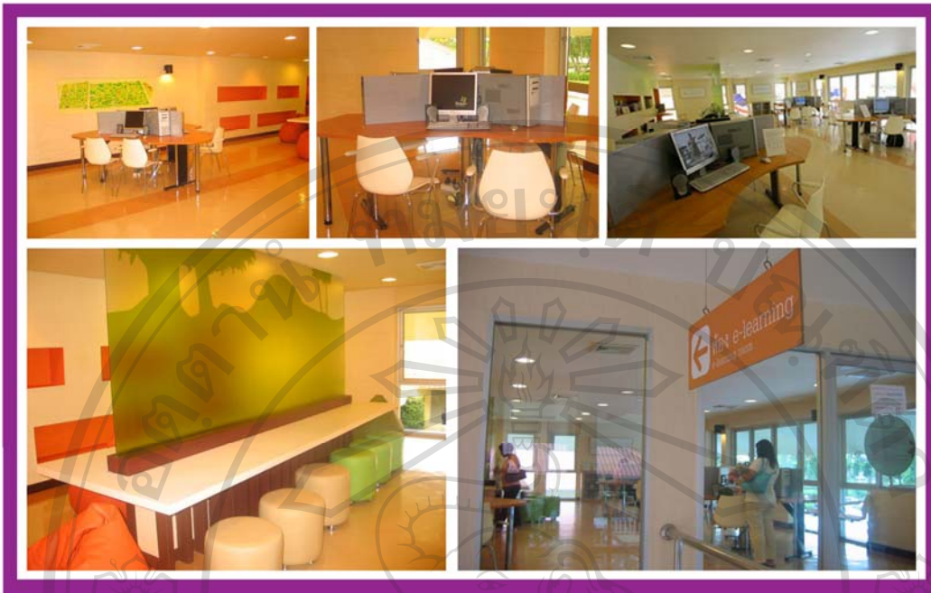
ภาพ 13 ภาพแสดงบรรยากาศภายในห้อง E – Learning