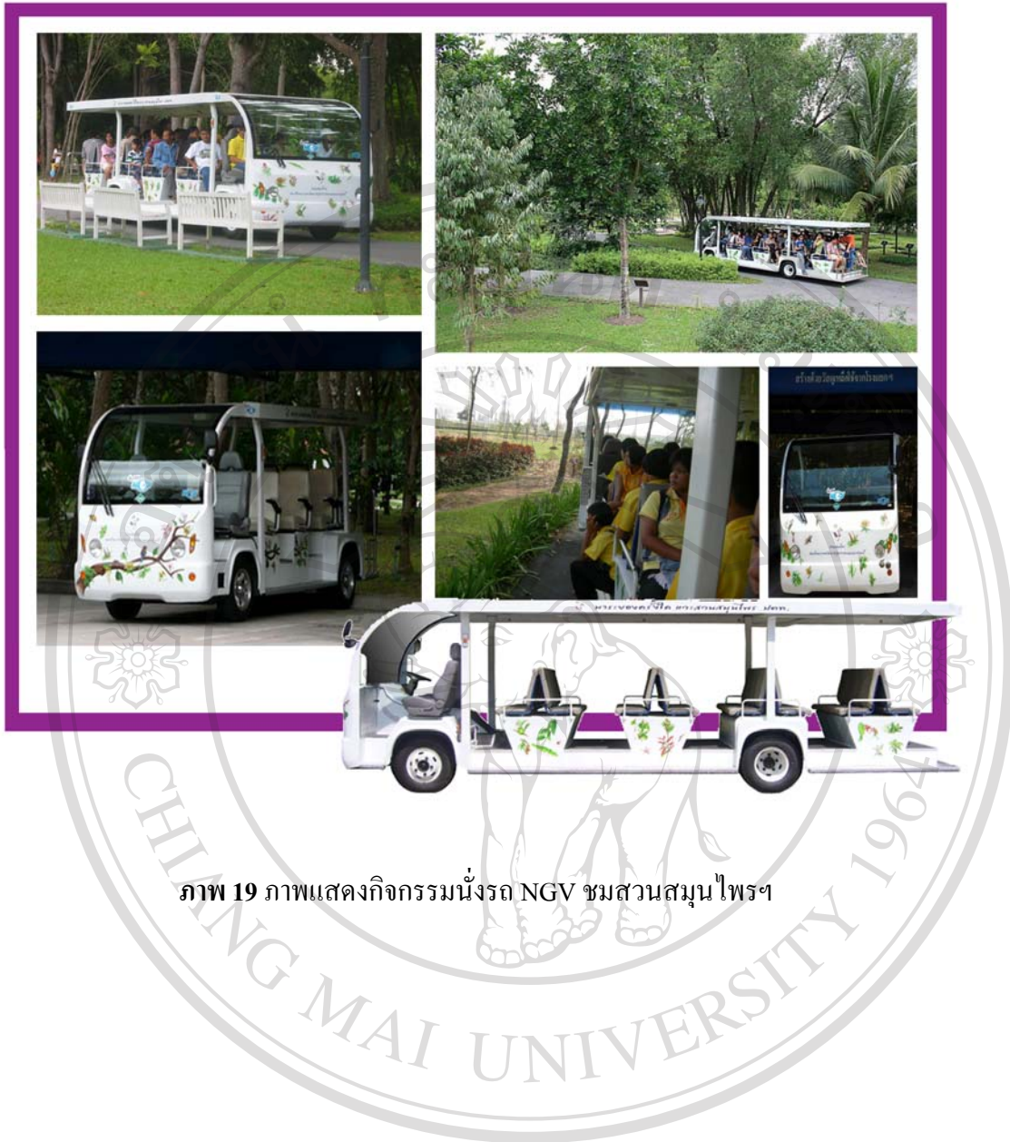
ภาพ 19 ภาพแสดงกิจกรรมนั่งรถ NGV ชมสวนสมุนไพรฯ