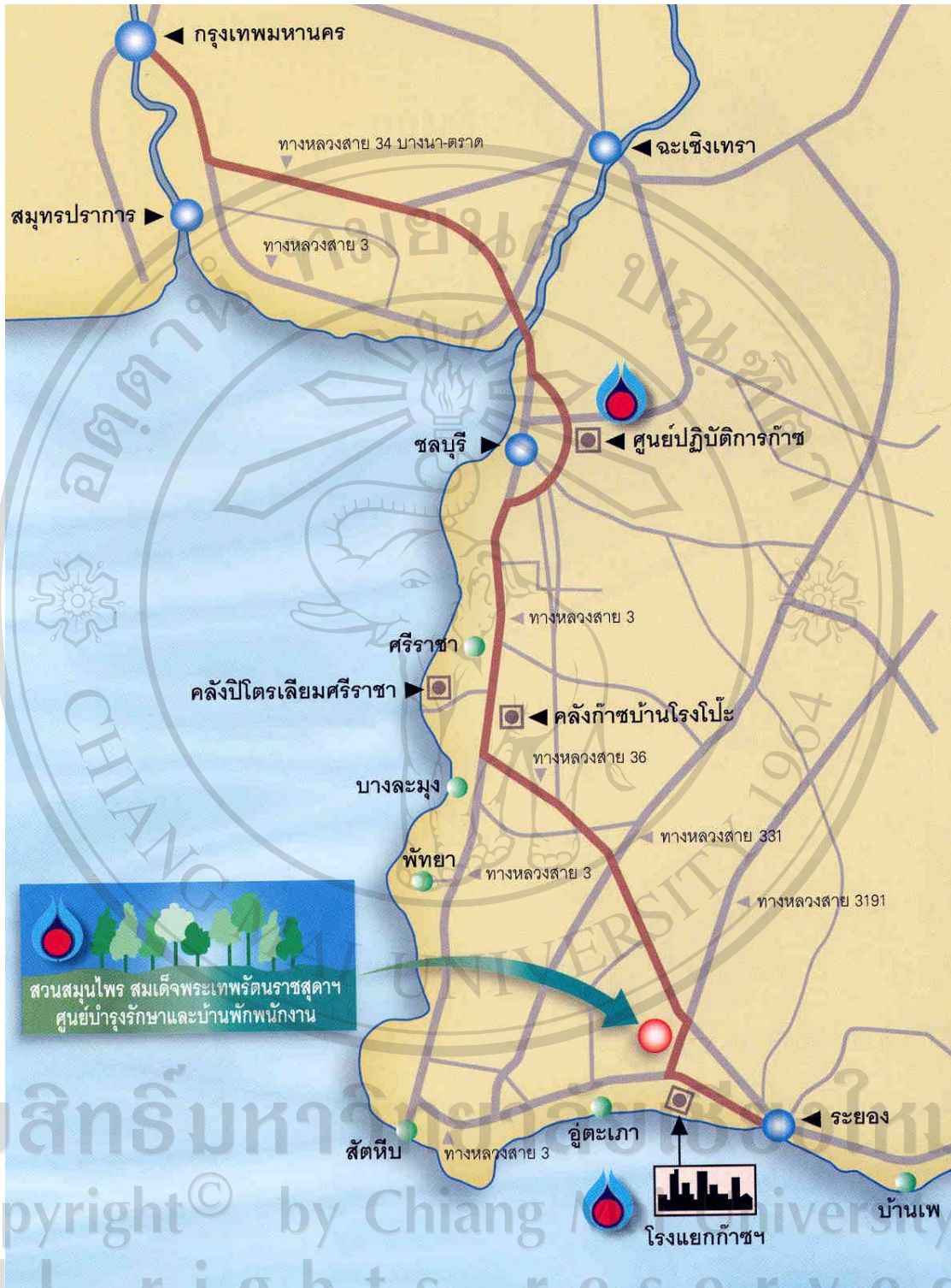
ภาพ 2 ภาพแสดงเส้นทางการเดินทางไปสวนสมุนไพรมสมเด็จพระเทพรัตนราชสุดาฯ สยามบรมราชกุมารี จังหวัดระยอง