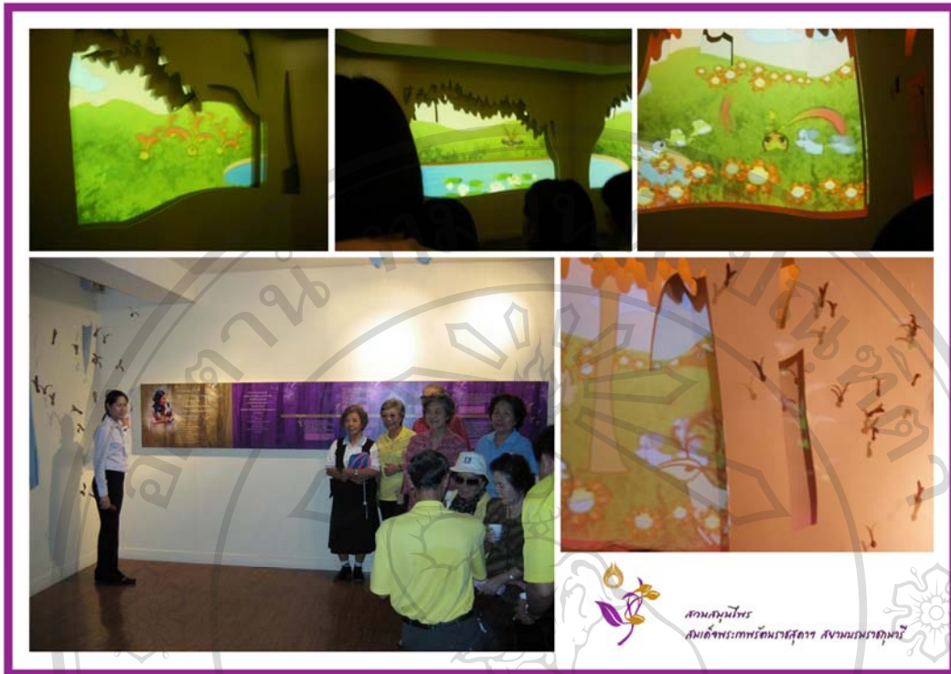
ภาพ 10 ภาพแสดงบรรยากาศภายในห้องการเดินทางของลูกยาง

ลิขสิทธิ์มหาวิทยาลัยเชียงใหม่ Copyright© by Chiang Mai University All rights reserved