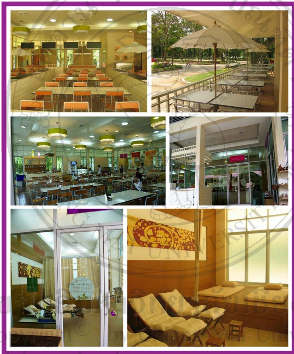
ภาพ 18 ภาพแสดงบรรยากาศส่วนบริการ (ร้านอาหาร / ร้านขายของที่ระลึก และห้องนวดเพื่อสุขภาพ)