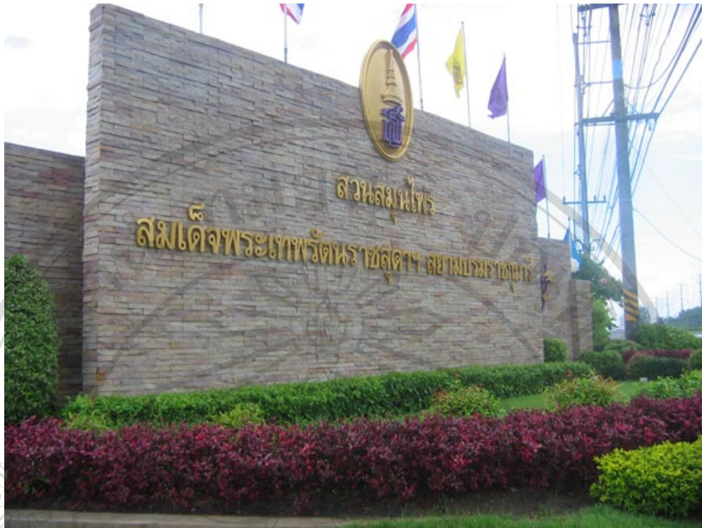
ภาพ 3 ภาพแสดงป้ายสวนสมุนไพรมหาสมุทร บริเวณหน้าประตูทางเข้าสวนสมุนไพรมหาสมุทร