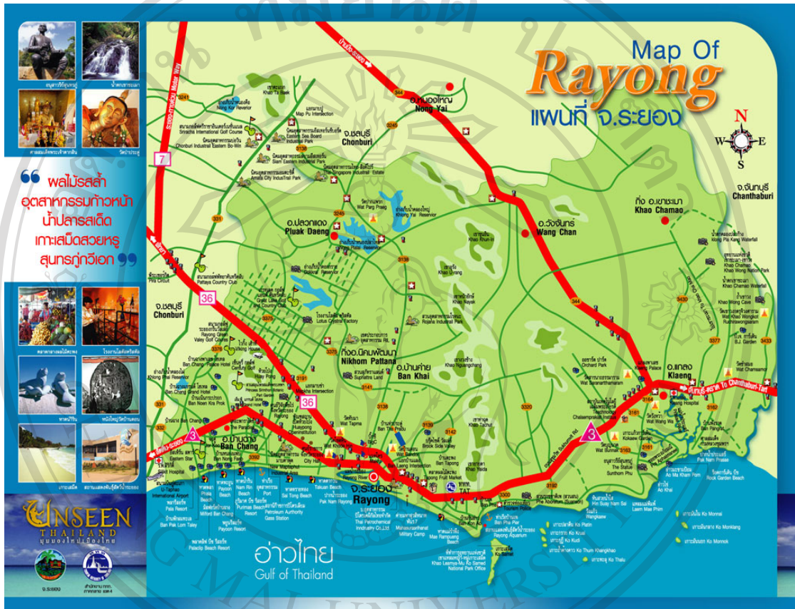
ภาพ 1 ภาพแสดงแผนที่จังหวัดระยอง

ลิขสิทธิ์มหาวิทยาลัยเชียงใหม่ Copyright© by Chiang Mai University All rights reserved