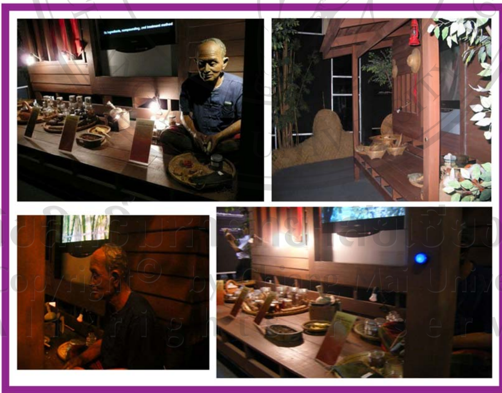
ภาพ 14 ภาพแสดงบรรยากาศภายใน “ห้องป่า.. แหล่งกำเนิดสมุนไพร” และ “บ้านหมอยา”