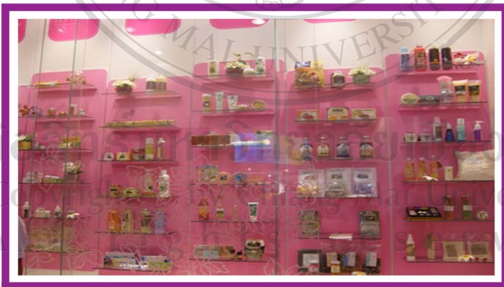
ภาพ 16 ภาพแสดงบรรยากาศภายในห้อง “ใช้สอยสารพัน”