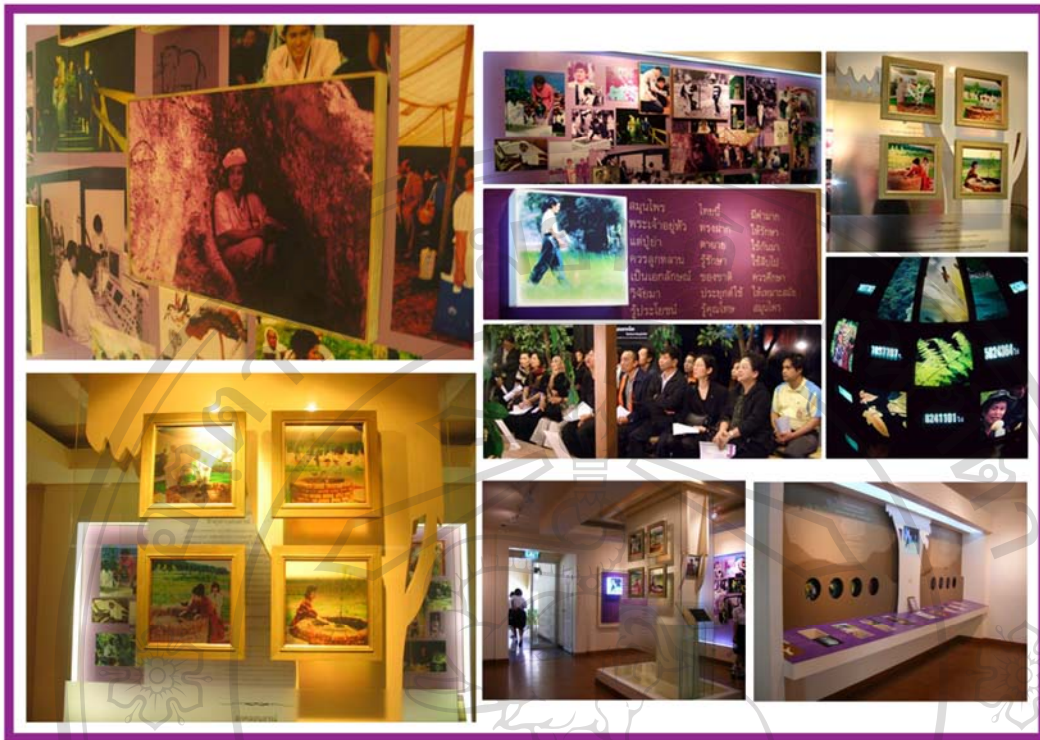
ภาพ 11 ภาพแสดงบรรยากาศภายในห้องนิทรรศการเจ้าฟ้านักอนุรักษ์