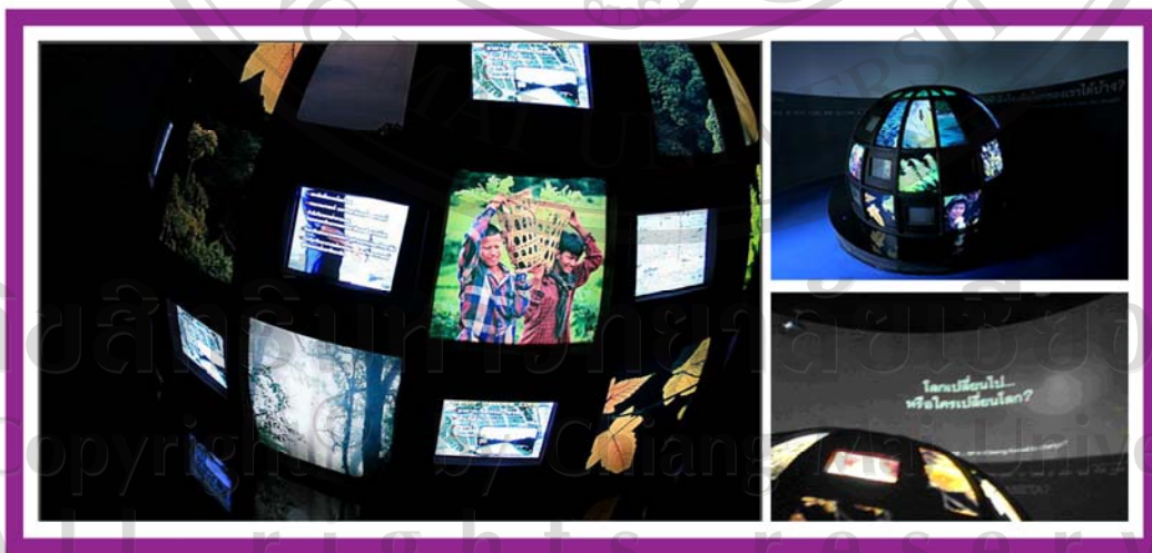
ภาพ 12 ภาพแสดงบรรยากาศภายในห้องพลังไทยพิทักษ์โลก