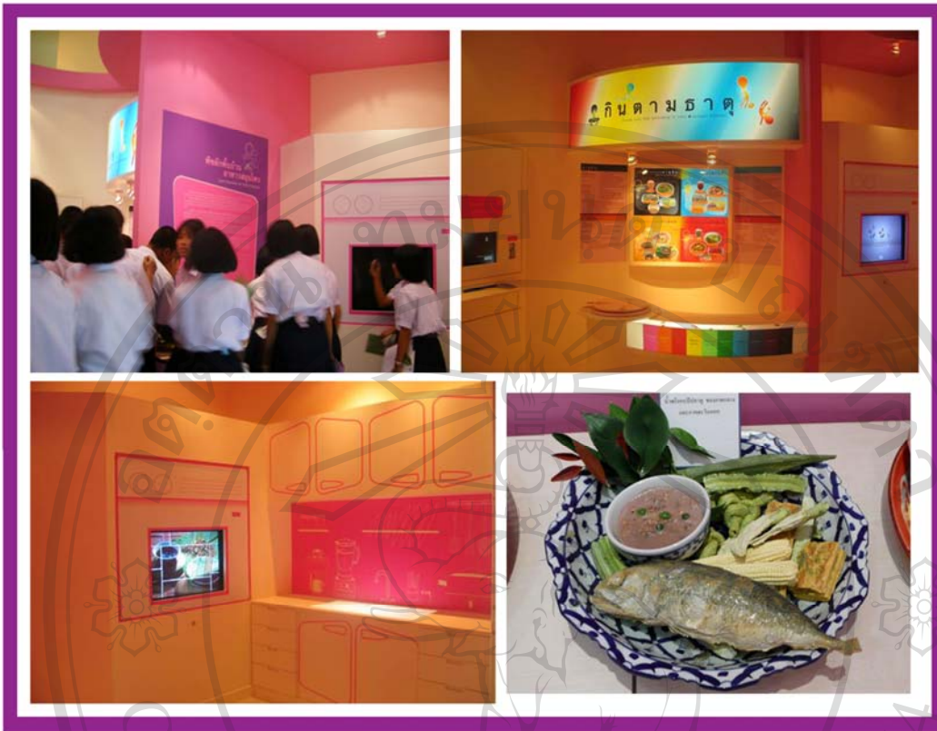
ภาพ 15 ภาพแสดงบรรยากาศภายในห้อง “ผักพื้นบ้าน อาหารสมุนไพร” และ ห้อง “กินตามธาตุ”