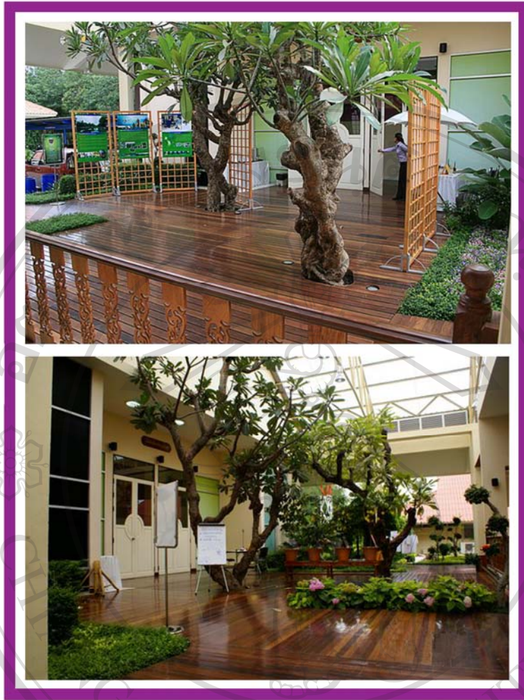
ภาพ 17 ภาพแสดงบรรยากาศลานกิจกรรม บริเวณหน้าอาคารพิพิธภัณฑ์สวนสมุนไพร

ลิขสิทธิ์มหาวิทยาลัยเชียงใหม่ Copyright© by Chiang Mai University All rights reserved