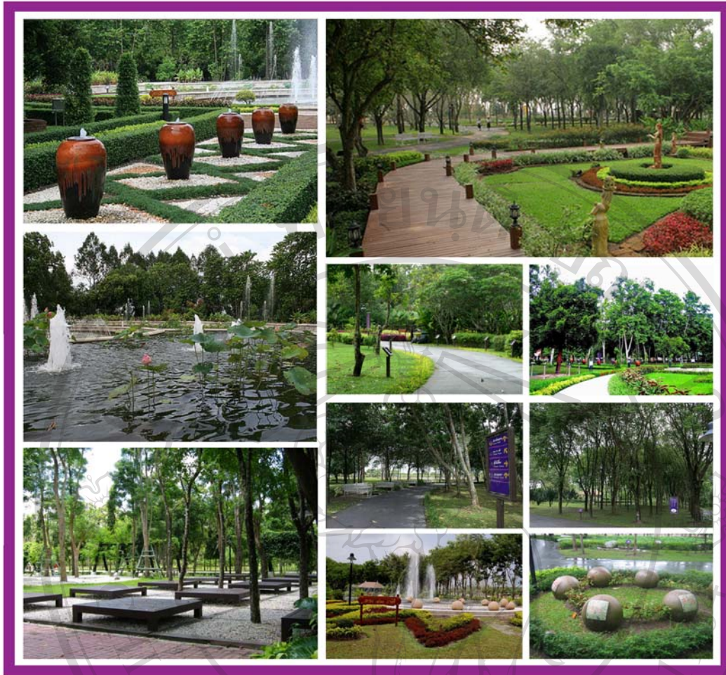
ภาพ 21 ภาพแสดงบรรยากาศความสวยงามภายในสวนสมุนไพรฯ

ลิขสิทธิ์มหาวิทยาลัยเชียงใหม่ Copyright© by Chiang Mai University All rights reserved