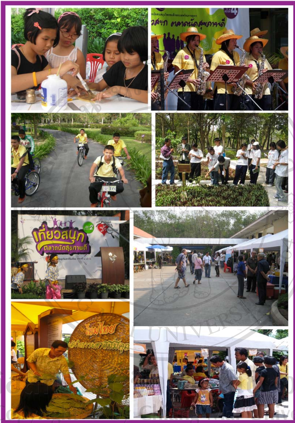
ภาพ 20 ภาพแสดงกิจกรรมต่างๆ ในสวนสมรมไพรฯ