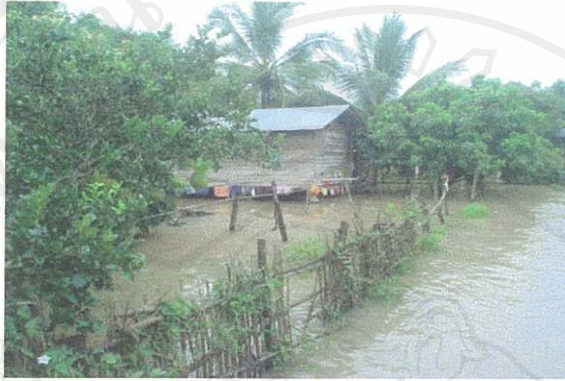
ภาพที่ 49 น้ำท่วมหมู่บ้านในฤดูฝน

และการท่องเที่ยว ซึ่งปกติในช่วงฤดูฝนเป็นช่วงที่การท่องเที่ยวค่อนข้างซบเซาอยู่แล้ว แต่ก็ยังสามารถผลักดันนักท่องเที่ยวให้เดินทางท่องเที่ยวได้หากมีการประชาสัมพันธ์ที่ดี เช่น การเดินทางท่องเที่ยวในช่วงวันหยุดสุดสัปดาห์ (Long Weekend) หรือการเดินทางของนักท่องเที่ยวในท้องถิ่น แต่หากปัญหาน้ำท่วมในช่วงฤดูฝนยังไม่มีแนวทางแก้ไขอย่างเป็นรูปธรรมหรืออย่างชัดเจน การจะพัฒนาให้เกิดการท่องเที่ยวช่วงฤดูฝนคงไม่สามารถทำได้