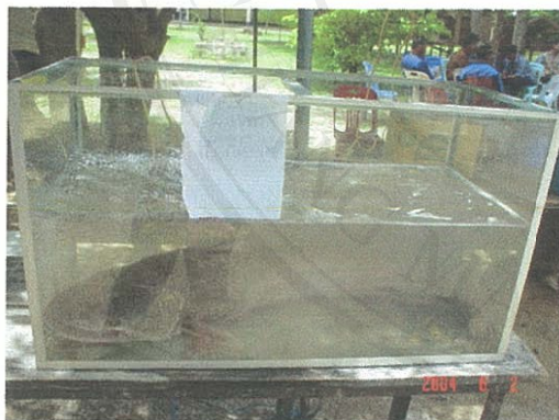
ภาพที่ 45 ปลาตัว ปลาที่มีชื่อเสียงของแม่น้ำอิง

การที่ชุมชนเวียงล่อตั้งอยู่ในแอ่งที่ราบ มีหุบเขาล้อมรอบ มีแม่น้ำอิงไหลผ่าน และมีทรัพยากรสัตว์น้ำที่เป็นเอกลักษณ์ คือ ปลาหน้าอิง (ภาพที่ 45) จึงเหมาะสมอย่างยิ่งสำหรับการท่องเที่ยวเชิงนิเวศ กล่าวคือ มีทัศนียภาพสวยงาม (ภาพที่ 46) สามารถจัดการท่องเที่ยวได้ทั้งทางบกและทางน้ำ โดยทางน้ำสามารถจัดให้มีการท่องเที่ยวชมธรรมชาติ จาก การพายเรือแคนู เรือคายัค หรือเรือพื้นบ้าน เช่น เรือขุด หรือเรือท้องแบน ผสมกับการทำกิจกรรมหาปลาแบบประมงพื้นบ้าน และการทำอาหารแบบพื้นบ้านจากสัตว์น้ำที่จับมาได้ สำหรับทางบกสามารถจัดทำเส้นทางเพื่อการท่องเที่ยว นันทนาการ เช่น เส้นทางจักรยานเสือภูเขา ชมวิวทิวทัศน์ ชมขอบเขตแนวเมืองโบราณ