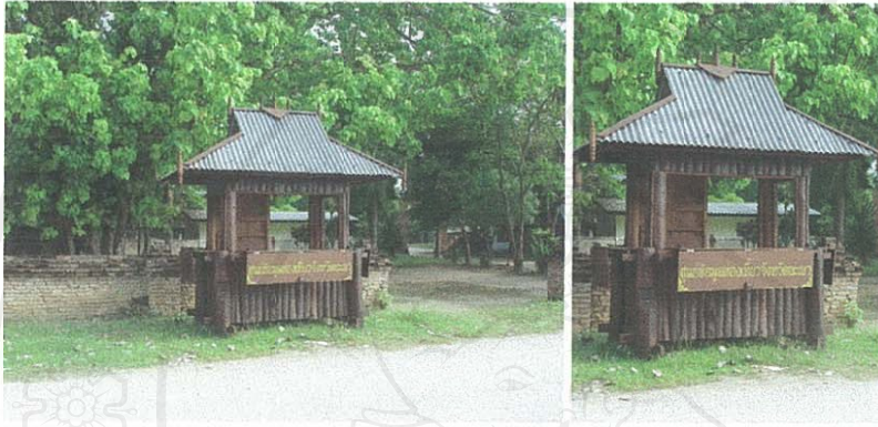
ภาพที่ 47 และ 48 ศูนย์บริการข้อมูลข่าวสารที่ทางจังหวัดจัดทำให้กับเวียงลอ ตั้งอยู่หน้าวัดศรีปิงเมือง

ในส่วนของจังหวัด ก็ไม่ได้ให้ความสำคัญกับชุมชนเวียงลอในฐานะเป็นเมืองโบราณรุ่นเก่า ในพื้นที่เขตการปกครอง ไม่มีการประชาสัมพันธ์และให้งบประมาณสนับสนุนในการพัฒนาในช่วงที่ผ่านมา ในปัจจุบันทางจังหวัดได้จัดทำศูนย์ให้บริการข้อมูลข่าวสารขนาดเล็ก เป็นลักษณะป้อมเล็กๆ สามารถเคลื่อนย้ายไปวางไว้ตามจุดต่างๆ ได้ ให้กับทางตำบล โดยจัดวางไว้หน้าวัดศรีปิงเมือง (ภาพที่ 47 - 48) แต่ทาง อบต. ยังไม่ได้ดำเนินการในเรื่องบุคลากรและสื่อประชาสัมพันธ์