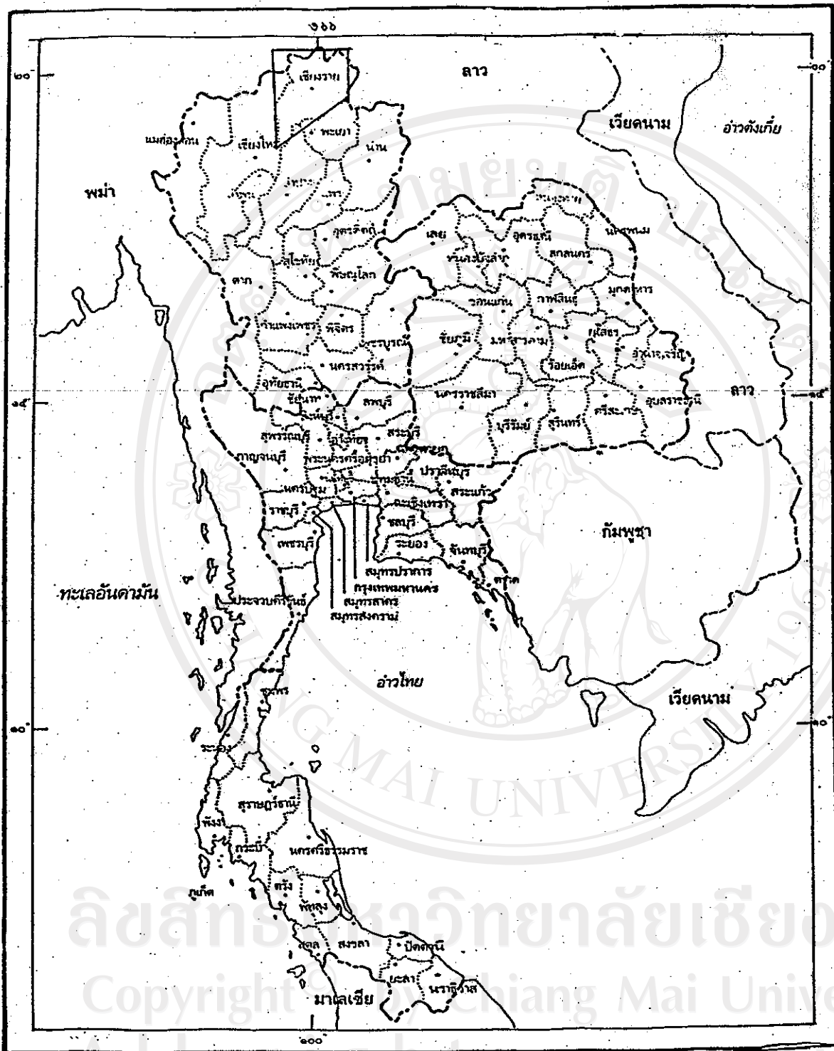
ภาพที่ 1.1 แสดงแผนที่ประเทศไทย