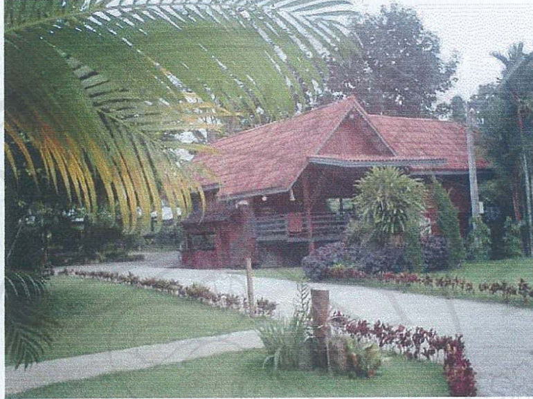
รูปภาพที่ 8 แสดงถนนเข้าสู่ที่พัก