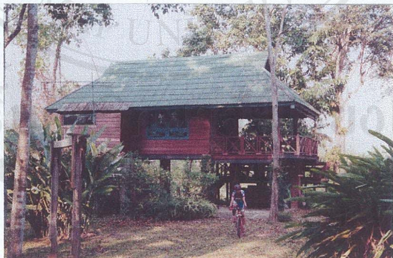
รูปภาพที่ 6 แสดงที่พักในตำบลโป่งน้ำร้อน