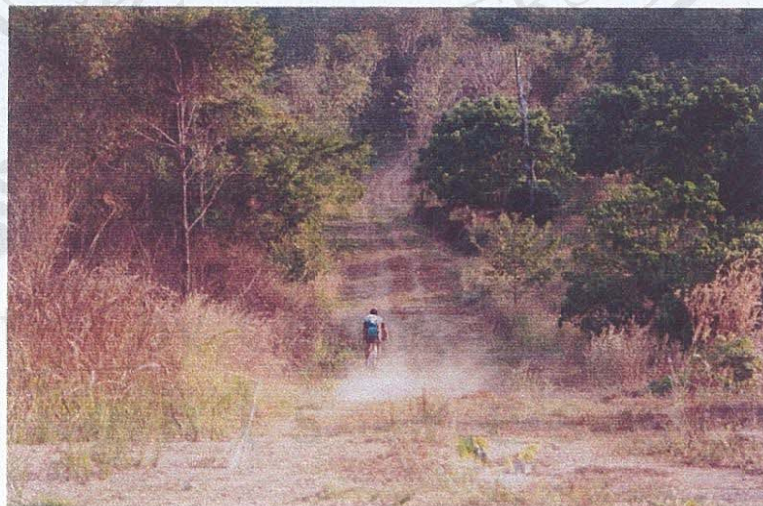
รูปภาพที่ 7 แสดงทางเข้าป่าโป่งน้ำร้อน

การเข้าถึงสถานที่ท่องเที่ยวทำได้โดยนำพาหนะส่วนตัวมาเอง หรือมากับบริษัททัวร์ บริษัทท่องเที่ยวที่พานักท่องเที่ยวมาเที่ยวล่องแก่งโป่งน้ำร้อน มีสำนักงานอยู่ในกรุงเทพมหานคร จำนวน 2 บริษัททัวร์ คือ พุจิวอร์ และวังขอนชาเลต์ นักท่องเที่ยวสามารถจองทัวร์ได้ที่กรุงเทพฯ บริษัททัวร์จะนำนักท่องเที่ยวเข้ามาในพื้นที่ โดยรถตู้สำหรับคณะที่มีจำนวนนักท่องเที่ยวไม่เกิน 12 คน เนื่องจากการล่องแก่งคลองโป่งน้ำร้อน ในแต่ละแพยางสามารถล่องได้ไม่เกิน 8 คนต่อเที่ยว นักท่องเที่ยวที่มีจำนวนมากกว่า 12 คน ทางบริษัทจะมีรถบัสนำนักท่องเที่ยวมายังตำบลโป่งน้ำร้อน สำหรับนักท่องเที่ยวที่เดินทางมาโดยรถประจำทาง มีบริการรถประจำทางเป็นลักษณะรถกระบะสีขาวประจำอยู่ที่ขนส่งในตัวเมืองจังหวัดจันทบุรีสู่ตำบลโป่งน้ำร้อนจำนวน 6 คันรถออกทุกชั่วโมงตั้งแต่เวลา 07.00 น. – 19.00 น. ค่าบริการ 30 บาทต่อคนหรือแบบเหมาคันรถสามารถออกได้ทันที ราคา 300 บาท