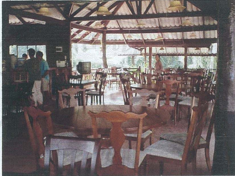
รูปภาพที่ 5 แสดงร้านอาหารในรีสอร์ท