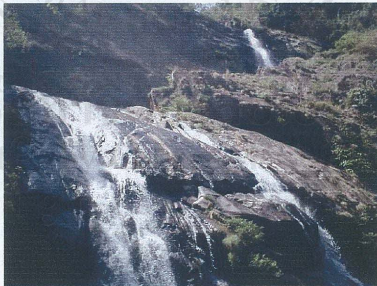
รูปภาพที่ 4 แสดงสิ่งดึงดูดใจในการท่องเที่ยว (2)