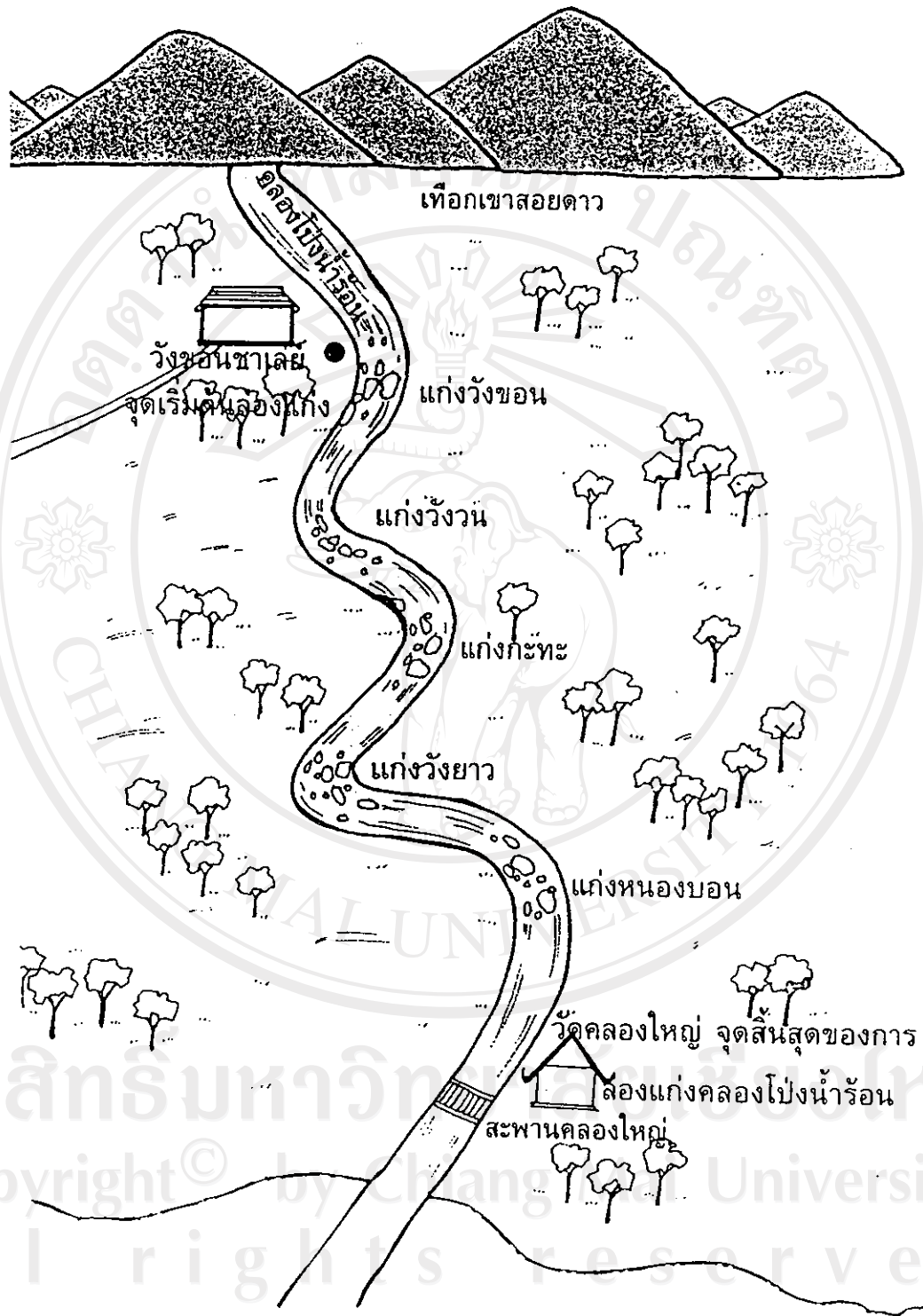
กัมพูชาประชาธิปไตย