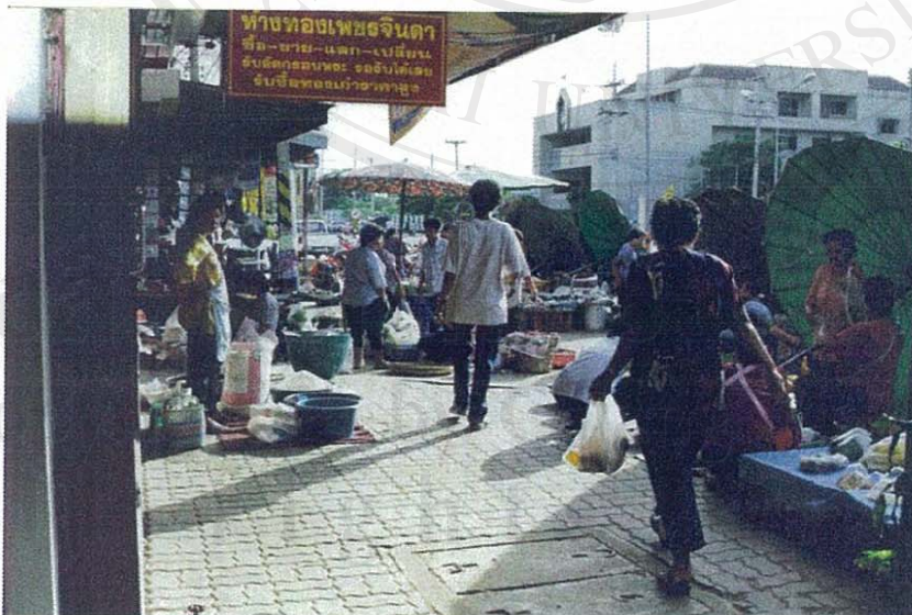
ภาพที่ 2 บริเวณด้านหน้าตลาดบริเวณริมทางเดินสาธารณะ