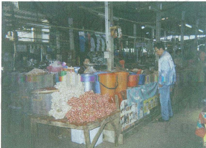
ภาพที่ 8 การจัดวางสินค้าของผู้ขายอาหารแปรรูป