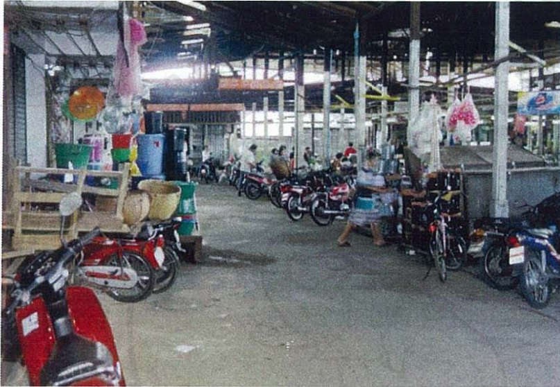
ภาพที่ 3 ด้านหลังตลาดด้านในตัวอาคาร