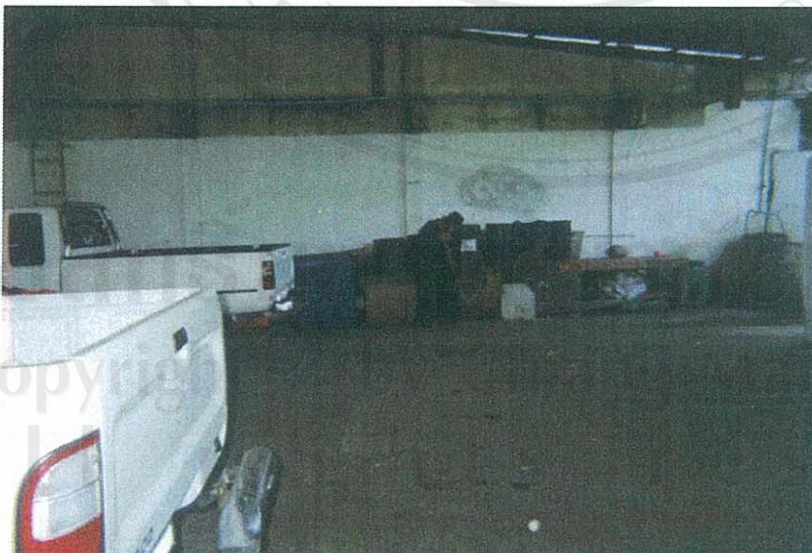
ภาพที่ 6 คนเก็บกวาดขยะบริเวณที่พักขยะของตลาด