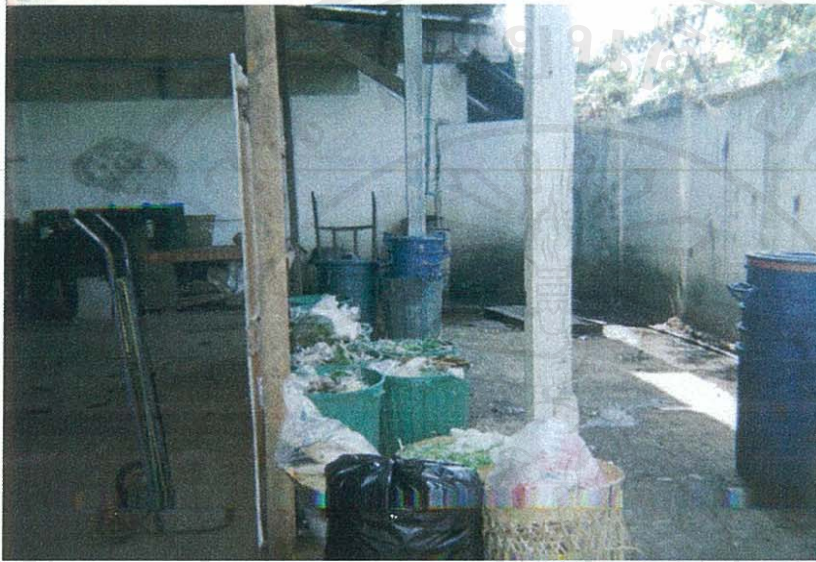
ภาพที่ 7 ที่พักขยะด้านหลังตลาด