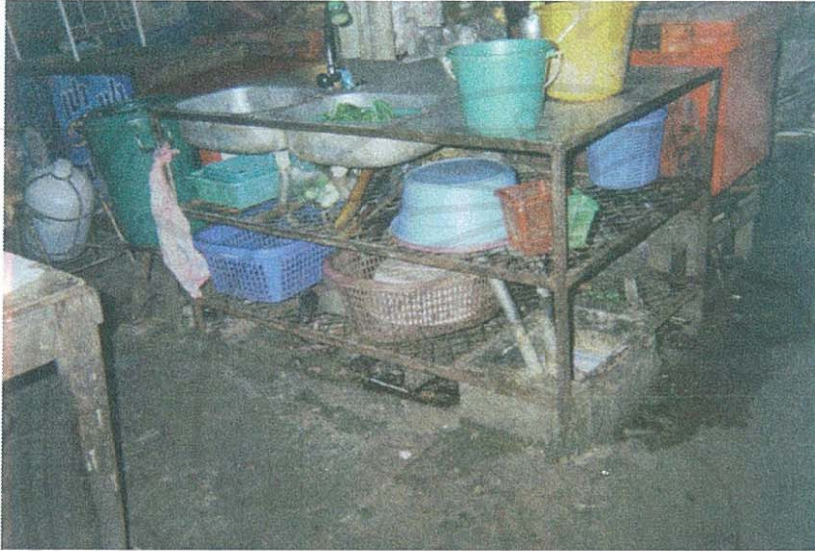
ภาพที่ 5 ทางระบายน้ำบริเวณร้านอาหาร