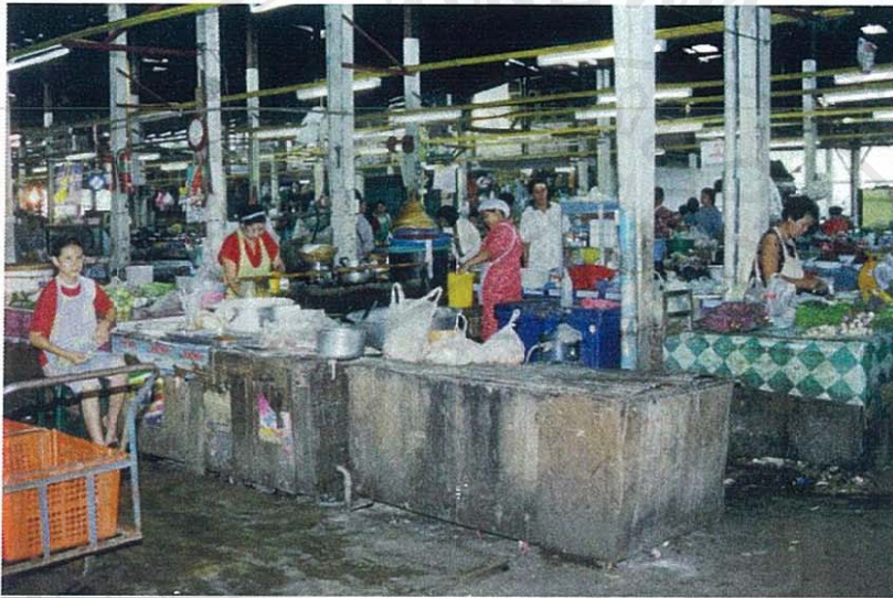
ภาพที่ 1 บริเวณด้านในอาคารตลาด