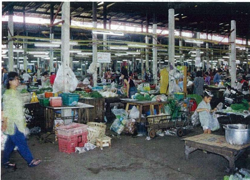
ภาพที่ 4 ปัญหาสิ่งแวดล้อมภายในตัวอาคารตลาด