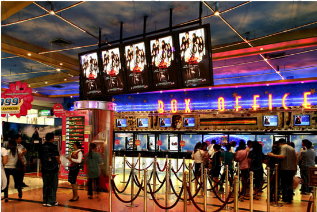
รูปที่ 3.1 ตัวอย่างบริเวณที่จำหน่ายตั๋วของโรงภาพยนตร์ของโครงการ

ค่ายหนังจะมีการคิดค่าลิขสิทธิ์เป็นเปอร์เซ็นต์ของราคาค่าตั๋วเข้าชมภาพยนตร์ โดยมีการแบ่งตามเกรดของภาพยนตร์ เช่น ภาพยนตร์ระดับ 5 ดาว (เช่น เรื่องแฮรี่พอร์ตเตอร์ เป็นต้น) ค่ายหนังจะคิดประมาณ 70% ของราคาค่าตั๋วเข้าชม, ภาพยนตร์ระดับ 4 ดาว จะคิดประมาณ 60% ของราคาค่าตั๋วเข้าชม และระดับ 3 ดาว จะคิดประมาณ 50% ของราคาค่าตั๋วเข้าชม ตามลำดับ ซึ่งทั้งนี้ขึ้นอยู่กับอำนาจการต่อรองของโรงภาพยนตร์ด้วยว่ามีอำนาจการต่อรองมากน้อยเพียงใด