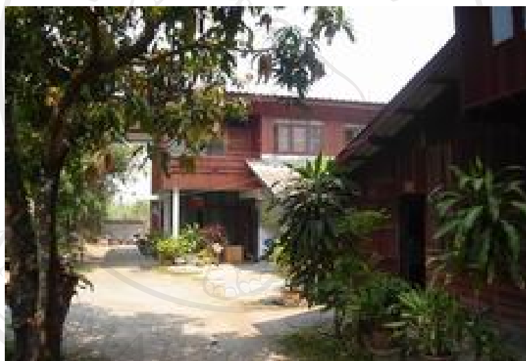
รูปที่ 4.2 สถานที่ตั้งกลุ่มแม่บ้านเกษตรกรบ้านสันก้างปลา

บ้านสันก้างปลา เป็นหมู่บ้านหนึ่งในตำบลทรายมูล อำเภอสันกำแพง จังหวัดเชียงใหม่ มีวัฒนธรรมไทเขินเป็นเอกลักษณ์ประจำหมู่บ้าน ด้วยสมาชิกของครัวเรือนในแต่ละครัวเรือนจะประกอบอาชีพทางการเกษตร สมาชิกจึงเกิดการว่างงานนอกฤดูการเกษตร ทำให้ต้องหาอาชีพเสริมเพื่อเพิ่มรายได้ให้ครอบครัว พร้อมกับสมาชิกในหมู่บ้านมีความชำนาญในด้านหัตถกรรมการฝีมือที่มีมาแต่ดั้งเดิม การสืบสานวัฒนธรรมในงานหัตถกรรมจึงเกิดขึ้น เพื่อเพิ่มรายได้และเป็นการอนุรักษ์งานหัตถกรรมไม่ให้สูญหายไปกับอดีต ประกอบกับการใช้ชีวิตวิถีแบบเรียบง่าย แต่ละหลังคาเรือนจะมีที่ทอผ้าไว้สำหรับทอผ้าจุกถูลูกธนูถวายพระภิกษุสงฆ์และทอเพื่อใช้เป็นเครื่องนุ่งห่ม