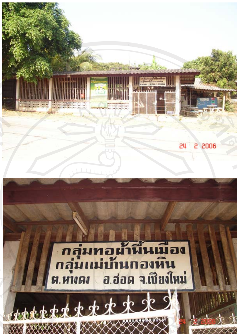
รูปที่ 4.4 สถานที่ตั้งกลุ่มทอผ้าแม่บ้านกองหิน

กลุ่มทอผ้าแม่บ้านกองหิน มีลักษณะการประกอบการแบบกลุ่ม (โดยมุ่งเน้นกิจกรรมทางสังคมเป็นหลัก และมุ่งแสวงหาประโยชน์ทางสังคมแก่ชุมชนมากกว่าการแสวงหากำไรสูงสุด) ก่อตั้งขึ้นในปี พ.ศ. 2542 จากการรวมกลุ่มของแม่บ้านในหมู่บ้านที่ได้ทำการทอผ้าถวายสมเด็จพระนางเจ้าพระบรมราชินีนาถและได้รับพระมหากรุณาธิคุณในการพระราชทานเงินทุนแรกเริ่ม จำนวน 20,000 บาท จึงได้ประกาศรับสมาชิกกลุ่มเพิ่มเติมและทำการจัดตั้งกลุ่มอย่างเป็นทางการ โดยมีวัตถุประสงค์การก่อตั้งกลุ่ม ดังนี้