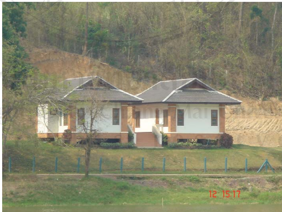
ภาพแสดงบ้านพักนักท่องเที่ยว