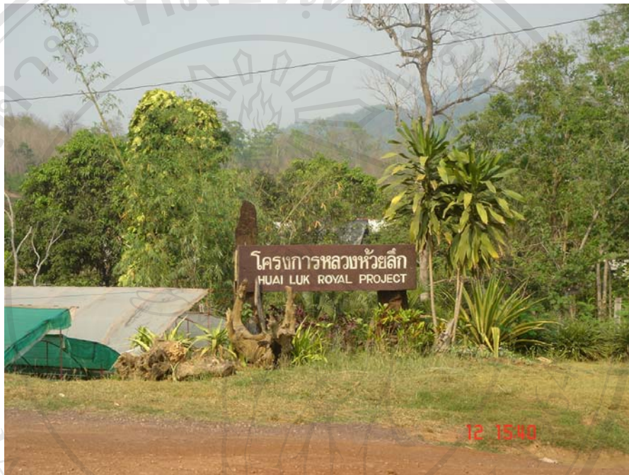
ภาพแสดงหน้าโครงการหลวงห้วยลึก

ภาพถ่ายภายในโครงการหลวง ห้วยลึก ในเดือนมกราคม พ.ศ. 2549