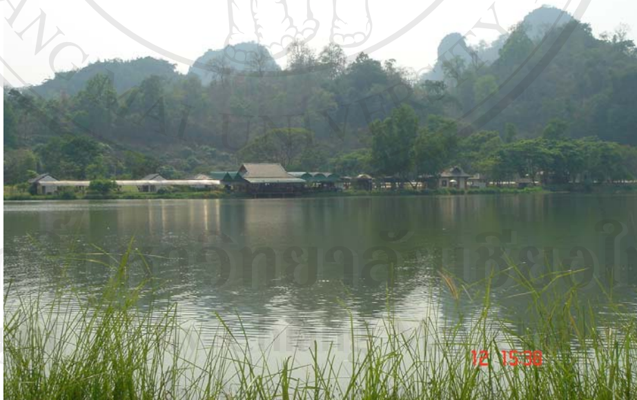
ภาพแสดงบริเวณโดยรวมของโครงการหลวงห้วยลึก