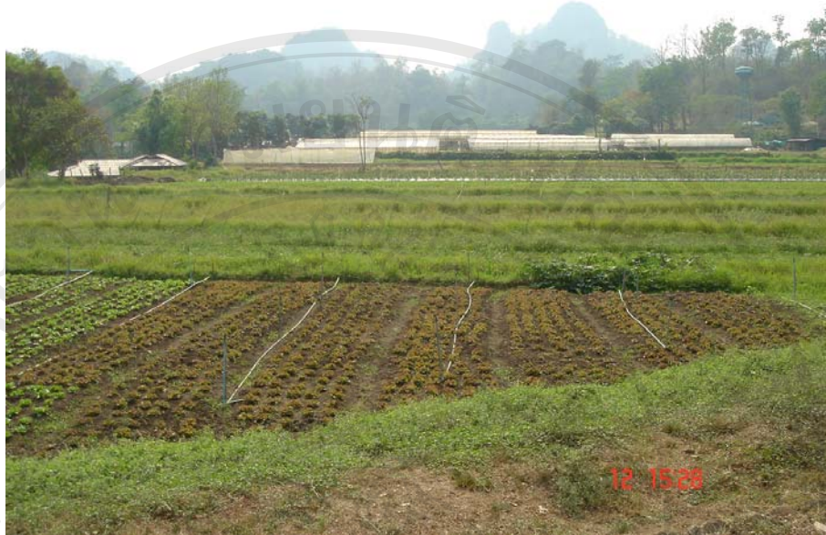
ภาพแสดงแปลงสาธิตเกษตร