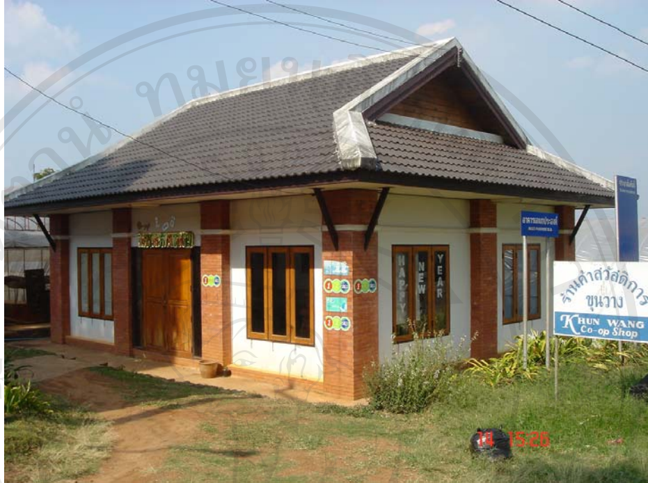
ภาพแสดงอาคารเอนกประสงค์