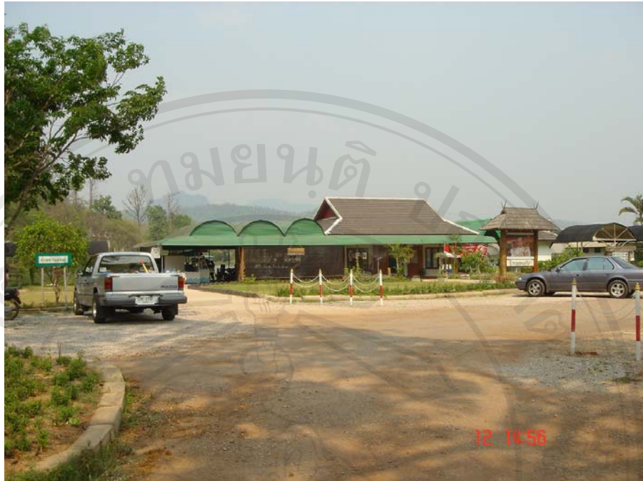
ภาพแสดงอาคารเอนกประสงค์