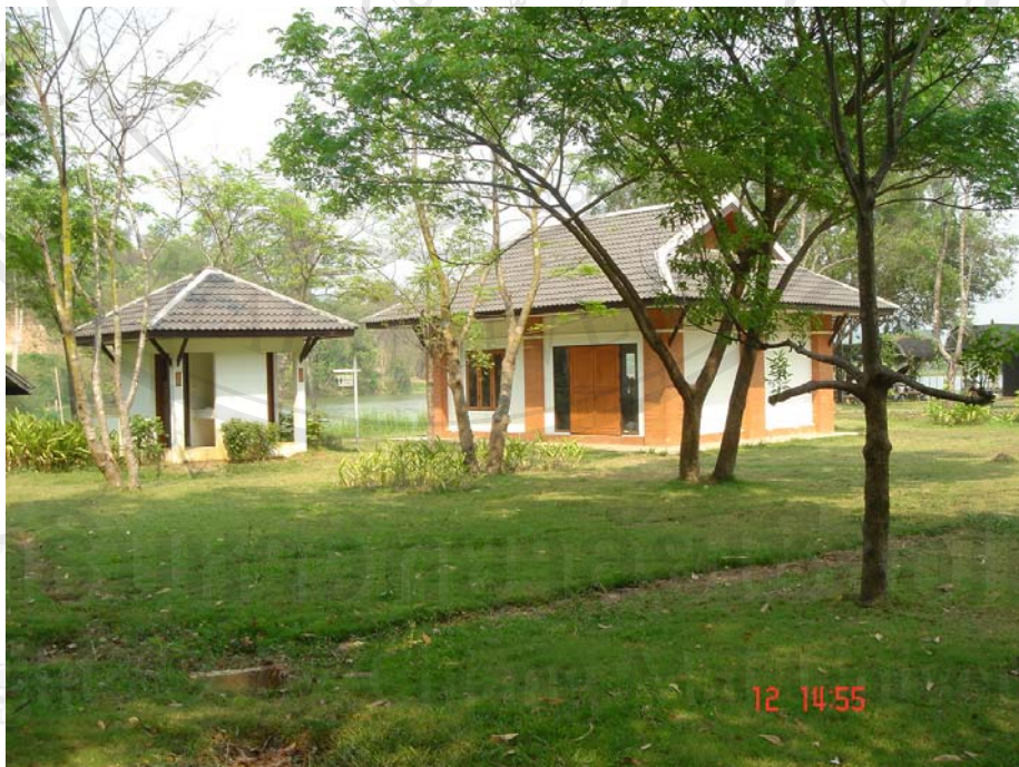
ภาพแสดงอาคารวัฒนธรรม