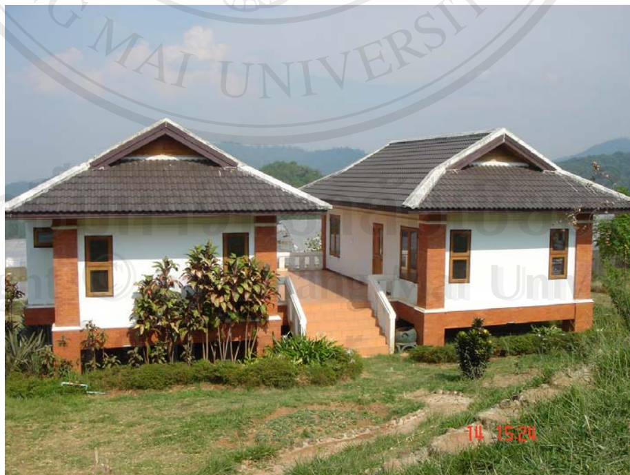
ภาพแสดงบ้านพักนักท่องเที่ยว