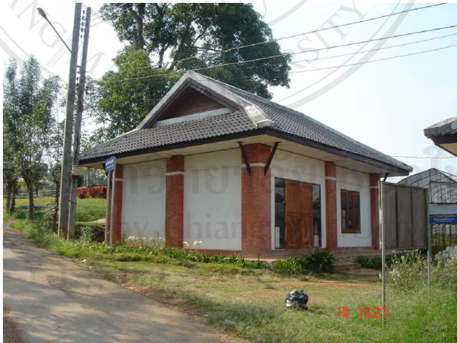
ภาพแสดงอาคารวัฒนธรรม