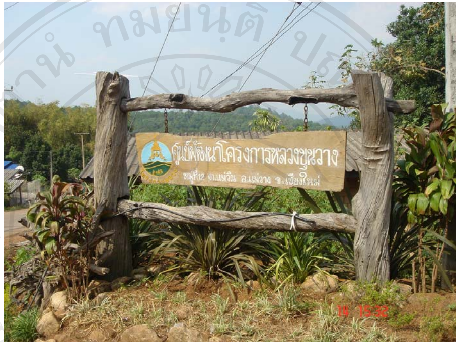
ภาพแสดงหน้าโครงการหลวงชุนวาง

ภาพถ่ายภายในโครงการหลวง ชุนวาง ในเดือนมกราคม พ.ศ. 2549