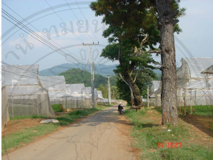
ภาพแสดงแปลงสาธิตเกษตร