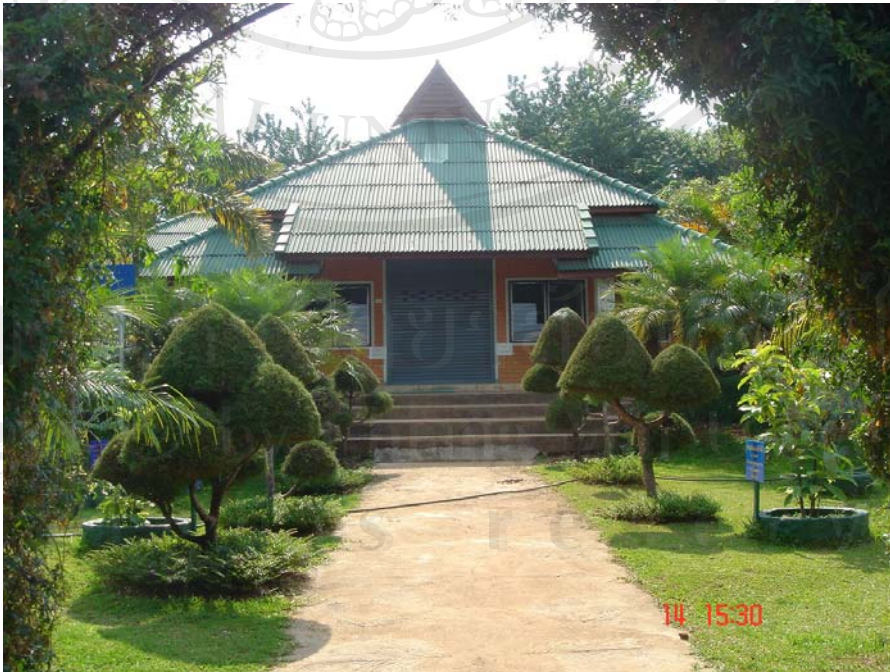
ภาพแสดงบริเวณอาคารสำนักงานของโครงการหลวงขุนวาง