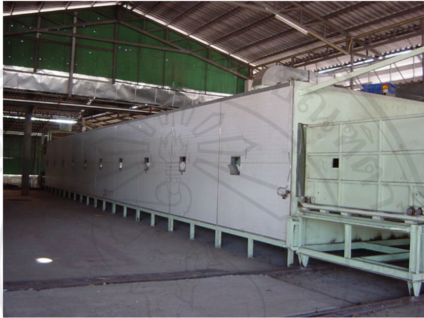
ภาพที่ 7 ถาดด้านหลังสำหรับนำลำไยที่อบแห้งแล้วออกจากเตอบ