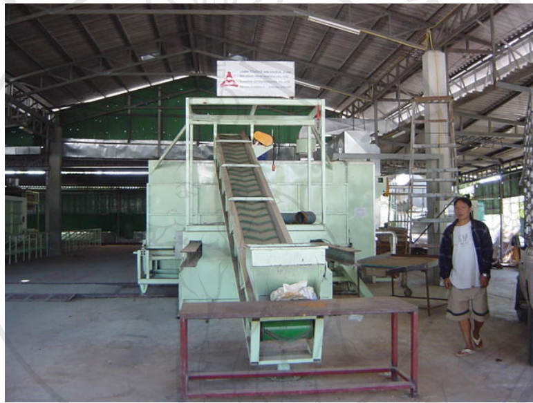
ภาพที่ 2 ถาดสำหรับรองรับลำไยสดที่ลำเลียงมาจากสายพานเพื่อเตรียมเข้าสู่เตาอบ