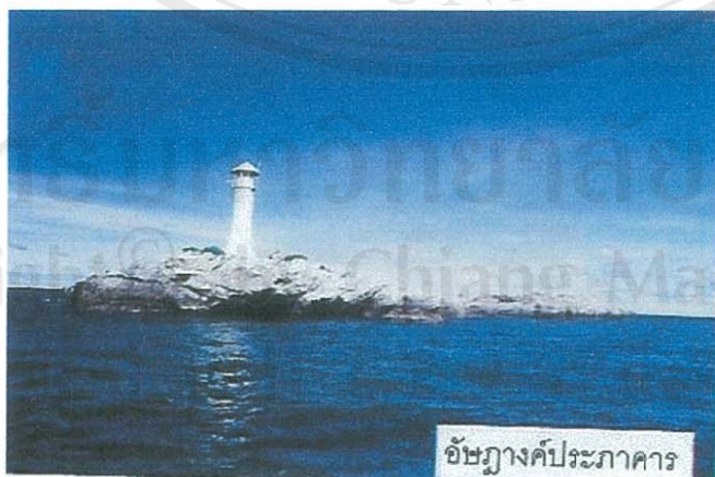
อัมพางค์ประภาคาร

ต่อมาเมื่อวันที่ 1 มกราคม 2486 กระทรวงมหาดไทยได้สั่งโอนกิ่งอำเภอเกาะสีชังจากอำเภอเมืองสมุทรปราการมาขึ้นกับอำเภอศรีราชา จังหวัดชลบุรี และได้ยกฐานะเป็นอำเภอเกาะสีชังเมื่อ วันที่ 3 กรกฎาคม 2537 จนกระทั่งได้มีการเปลี่ยนแปลงฐานะของสุขาภิบาล (พื้นที่เกาะสีชัง) เป็นเทศบาลตำบลเกาะสีชัง เมื่อวันที่ 25 พฤษภาคม 2542 โดยผลของพระราชบัญญัติเปลี่ยนแปลงฐานะของสุขาภิบาลเป็นเทศบาล พ.ศ. 2542 เทศบาลตำบลเกาะสีชังมีเขตการปกครอง 1 ตำบล คือตำบลท่าเทววงษ์ ประกอบด้วยชุมชน 6 ชุมชน คือ ชุมชนบ้านท่าเทววงษ์ ชุมชนบ้านศาลเจ้าแก้ว ชุมชนบ้านท่าวัง ชุมชนบ้านตรอกด่านภาษี ชุมชนบ้านสะพานคู่และชุมชนบ้านท่าภาณุรังษี (ส่วนหมู่ที่ 7 บ้านเกาะขามใหญ่อยู่ในเขตการปกครองขององค์การบริหารส่วนตำบลท่าเทววงษ์)