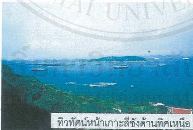
ทิวทัศน์หน้าเกาะสีชังด้านทิศเหนือ