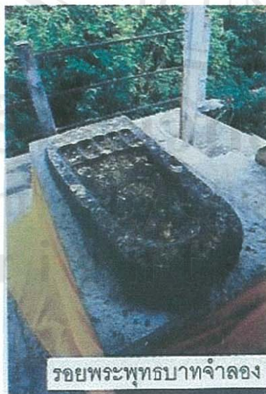
รอยพระพุทธรูปจำลอง

พระเจ้าบรมวงศ์เธอกรมพระยาดำรงราชานุภาพได้นำรอยพระพุทธรูปจำลองมาจากพุทธคยาในประเทศอินเดียและพระบาทสมเด็จพระจุลจอมเกล้าเจ้าอยู่หัวโปรดเกล้าฯ ให้อัญเชิญมาประดิษฐานไว้ ณ ไหล่เขาพระจุลจอมเกล้าเมื่อวันที่ 27 เมษายน 2434 พระพุทธรูปจำลองมีมณฑปพระพุทธรูปกว้าง 4 เมตร ยาว 4 เมตร เฉพาะรอยพระพุทธรูปกว้าง 11 นิ้ว ยาว 25 นิ้วครึ่ง ลึก 1 นิ้ว ลักษณะเส้นทางในการเดินทางขึ้นไปสักการะจะมีทางที่สร้างขึ้นในสมัยรัชกาลที่ 5 และภายหลังประชาชนมาสร้างทางเชื่อมกับศาลเจ้าพ่อเขาใหญ่ เพื่อสะดวกในการท่องเที่ยวแยกขึ้นสูงต่อไปมีบันไดถึงรอยพระพุทธรูปจำลองและสามารถมองเห็นทิวทัศน์อันสวยงามทั่วเกาะสี่ซัง ดังนั้น พระพุทธรูปจำลองจึงเป็นที่สักการะบูชาของประชาชนผู้มาเยือนที่เกาะนี้