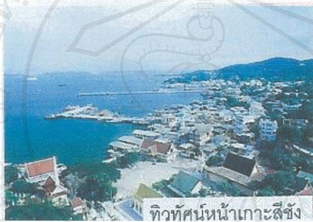
ทิวทัศน์หน้าเกาะสีชัง

เกาะสีชังเป็นชุมชนที่มีประเพณีสืบทอดมาจากอดีต ซึ่งมีลักษณะโดยรวมเหมือนกับประเพณีบนแผ่นดินใหญ่ จะแตกต่างกันในรายละเอียดบางประการเท่านั้น แต่ก็ยังคงประเพณีที่แสดงออกถึงลักษณะวิถีชีวิตไทยนั่นเอง ประเพณีเทศกาลที่ปรากฏให้เห็นในปัจจุบัน ได้แก่ เทศกาลสงกรานต์“วันไหล” ซึ่งนอกจากจะมีการทำบุญตามงานบวงสรวงสักการะเจ้าพ่อเขาใหญ่ และงานรำลึก 100 ปี ชาวสีชัง เป็นต้น