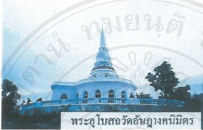
พระอุโบสถวัดอัมพวันนimitr