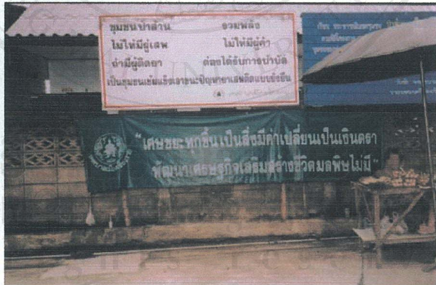
ภาพการรณรงค์ เพื่อจูงใจให้ประชาชนแยกขยะ