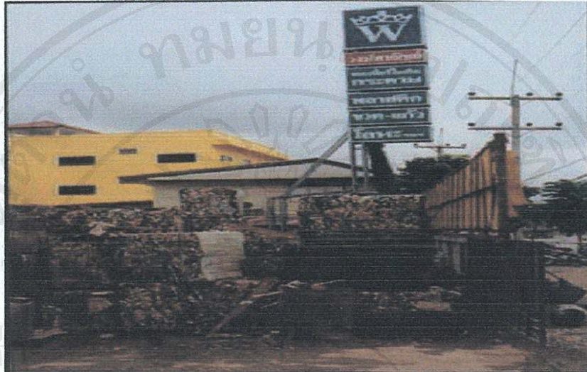
ภาพขยะรีไซเคิล ที่ถูกแปรสภาพและจัดให้เป็นหมวดหมู่