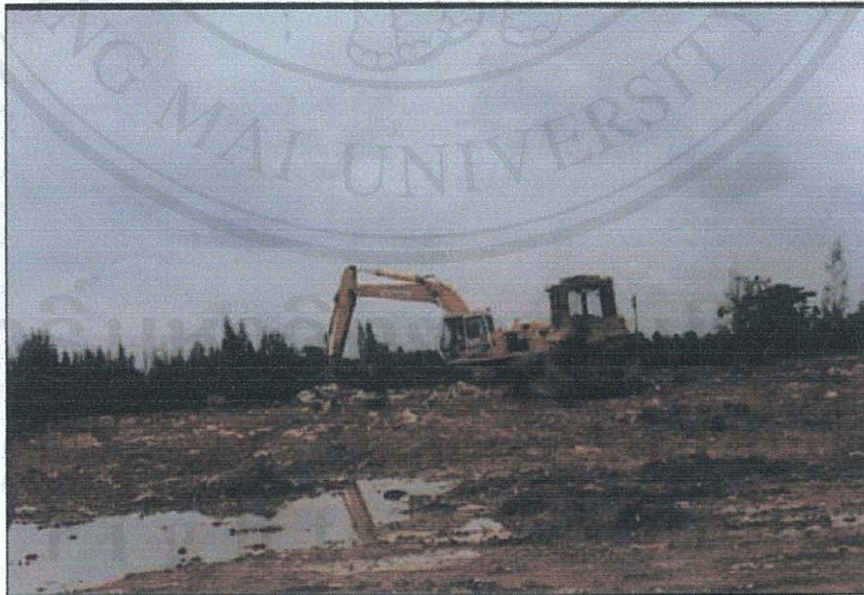
ภาพการกำจัดขยะแบบฝังกลบ ของเทศบาลเมืองเชียงราย