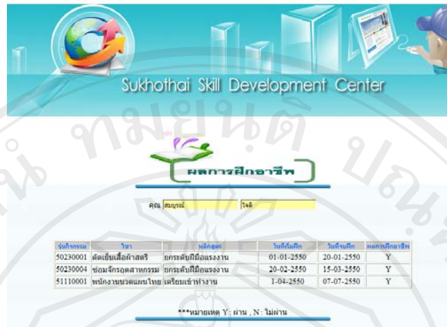
รูปที่ 5.3 แสดงหน้าจอผลการฝึกอาชีพ

5.1.3 ลดภาระงานความผิดพลาดในงานด้านการบันทึกข้อมูล ให้กับเจ้าหน้าที่ทะเบียน ฝ่ายส่งเสริมการพัฒนาฝีมือแรงงาน