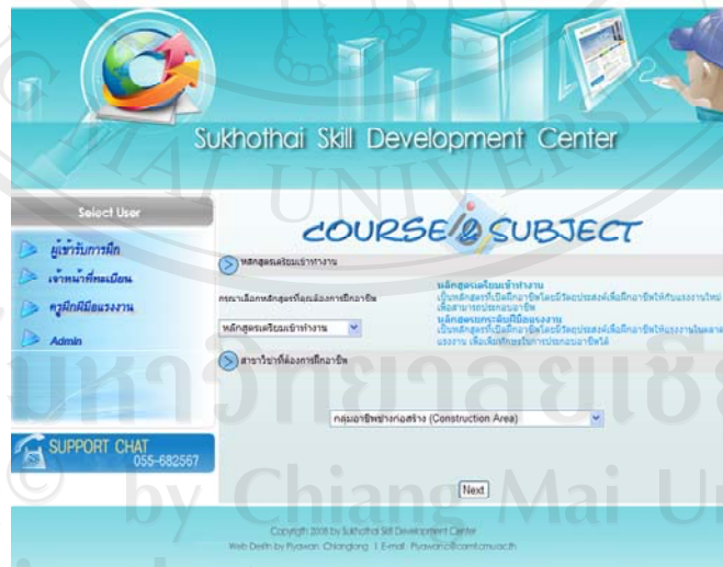
รูปที่ 5.2 แสดงหน้าจอของการลงทะเบียน

5.1.1 ผู้รับการศึกษาสามารถลงทะเบียนได้ด้วยตนเอง เพื่อตรวจสอบความถูกต้อง และเพื่อใช้ประกอบการพิจารณาและตัดสินใจในการลงทะเบียนเรียนในหลักสูตรและสาขาอาชีพอื่นๆ